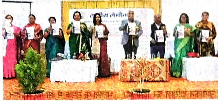
डोंगरगांव. कॉलेज में हुए सेमिनार में शामिल होने पहुंचे वक्ता।